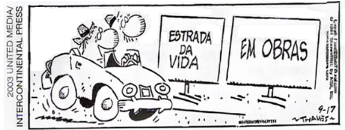
THAVES, Bob. Frank & Ernest .

Disponível em: https://conversadeportugues.com.br/2013/03/leitura/ . Acesso em: 8 fev. 2026.